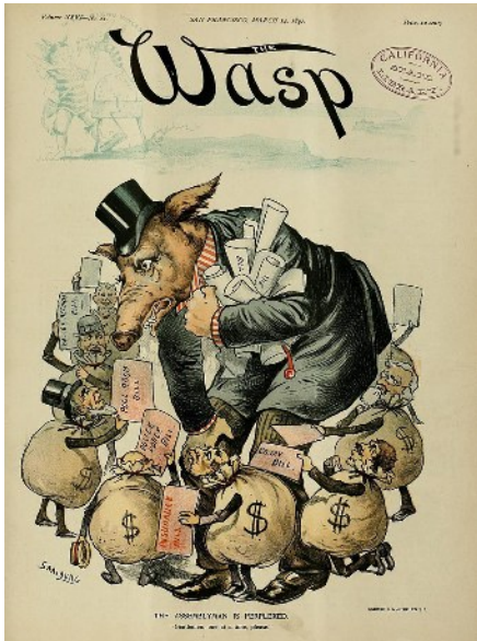
Karikatur von 1891 zur Lobbyarbeit für Gesetzesentwürfe (engl. bill) bei einem US-amerikanischen Abgeordneten

Die korrumpierten Parteiführungen der AfD stehen vor allem für eine national-konservative Orientierung und ergießen sich in ihrer Wahlwerbung in hochgradig populistischer Art auf die Zuwanderungspolitik der bisherigen Regierungen, die durch ihre politische Ausweglosigkeit die sozialen Gegensätze immer weiter zuspitzen, weil sie innenpolitisch im Rahmen des Lohnsklavensystems des Eigentumsrechts, und außenpolitisch im Rahmen der Räuberpolitik als Vasall des US-Imperiums, eine Politik für die reichsten Privat-Eigentümer (Oligarchen), vordringlich für US-Oligarchen betreiben, die die sozialen Gegensätze ganz logischerweise immer weiter zuspitzen müssen. Innenpolitisch durch die aus dem Eigentumsrecht resultierende Verelendungspolitik und außenpolitisch durch die Kriegspolitik der westlichen Räuberallianz, die natürlich zu Massenfluchtbewegungen führen muss. Möchte die AfD das ändern? Selbst wenn Parteiführungen das versprechen würden, wir wissen doch alle: Wahlversprechen sind in aller Regel verrechtlichter Wahlbetrug. Wir können Herrn Merz in dieser Hinsicht wirklich dankbar sein für seinen mit äußerster Frechheit und Arroganz vorgetragenen Bruch seiner Wahlversprechen, damit alle Illusionen in dieses betrügerische Repräsentationssystem zerbröseln, wie Sandburgen mit jeder neuen Wahlwelle.