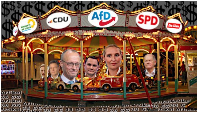
Fotomontage, Quellen: Kinderkarussell, siehe hier – Parteien siehe: AfD , CDU , SPD , GRÜNE , Die Linke , FDP