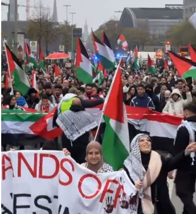
09.11.24 Hamburg – Alis Kamera

Abschluss bringen konnten und ich „Alis Kamera“ auf der Demo einen Redebeitrag halten durfte.