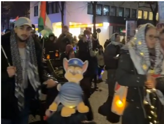
15.11.24 Hamburg – Alis Kamera

Diese Vorfälle sollten von den Veranstaltern ausgewertet werden und bessere Verhaltensweisen bei kommenden Veranstaltungen schon im Vorfeld gegenüber den Teilnehmern und Ordnern kommuniziert werden. Gewalttätiges Vorgehen gegen Provokateure, sollte nicht die Sache der Teilnehmer sein, da dies ja gerade das Ziel der Provokateure ist. Die Veranstalter sollten im Vorfeld noch deutlicher machen, dass gewalttätige Aktivitäten nicht von den Ordnern begleitet, sondern von der Demo deutlich abgeschottet werden. Ein ganz großes Dankeschön an die Veranstalter, dass sie die Veranstaltung trotz der Zwischenfälle, erfolgreich zum