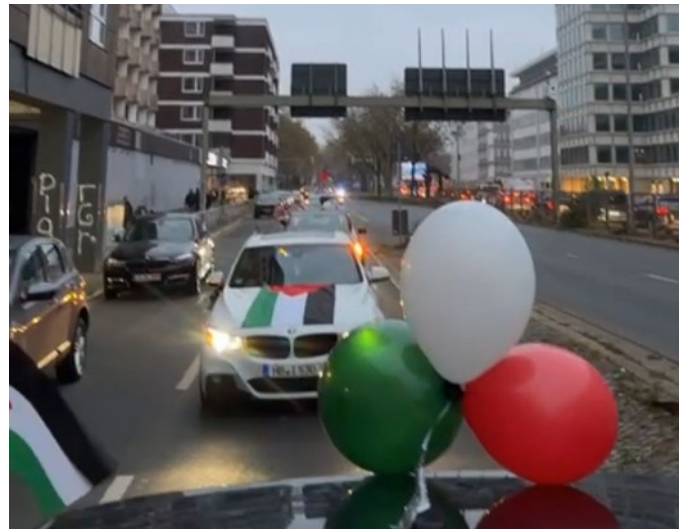
16.11.24 Bremen – Alis Kamera

Am 16.11.2024 habe ich mit meiner Kamera am Autokorso für Frieden in Palästina in Bremen teilgenommen. Ich danke dem Veranstalter für die gute Organisation und wünsche allen Interessierten viel Spaß beim Ansehen meiner Dokumentation.