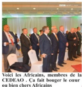
Voici les Africains, membres de la CEDEAO . Ça fait bouger le cœur ou bien chers Africains