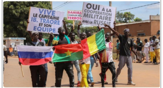
Pendant le coup d'état à Ouagadougou, la capitale du Burkina Faso, en octobre.

Après avoir quitté le Mali, les troupes françaises vont quitter le Burkina Faso d'ici un mois, a annoncé le ministère des Affaires étrangères mercredi. La junta au pouvoir au Burkina Faso a mis fin à l'accord de défense qui le liait à la France.